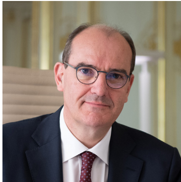
Jean Castex, Premier ministre

Déclaration de politique générale Assemblée nationale, 15 juillet 2020